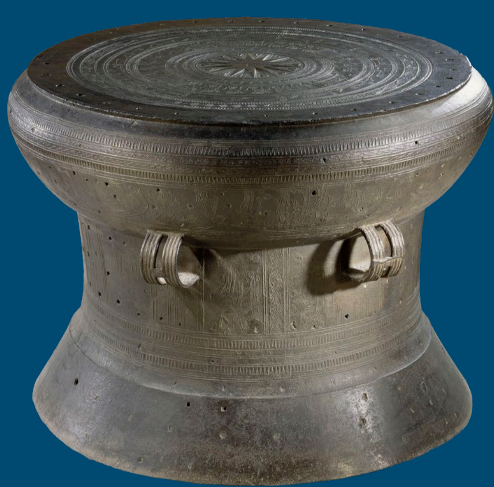
Tamboeur de bronze dit tambour « Moulié » (du nom du donateur E. Moulié) - Musée national des Arts asiatiques-Guimet - Inv. P243 - Vietnam - V e siècle avant notre ère - Dépôt du musée de l'Armée, 1953.

Les tambours de bronze font partie des objets les plus populaires d'une vaste zone qui comprend le Vietnam, la Chine du Sud, la Birmanie et l'Indonésie. D'innombrables exemplaires ainsi que des contes et légendes, mettant en scène ces instruments de musique, montrent quel rôle important ils ont joué et jouent encore de nos jours dans l'histoire et l'imaginaire des populations du Sud-Est asiatique.