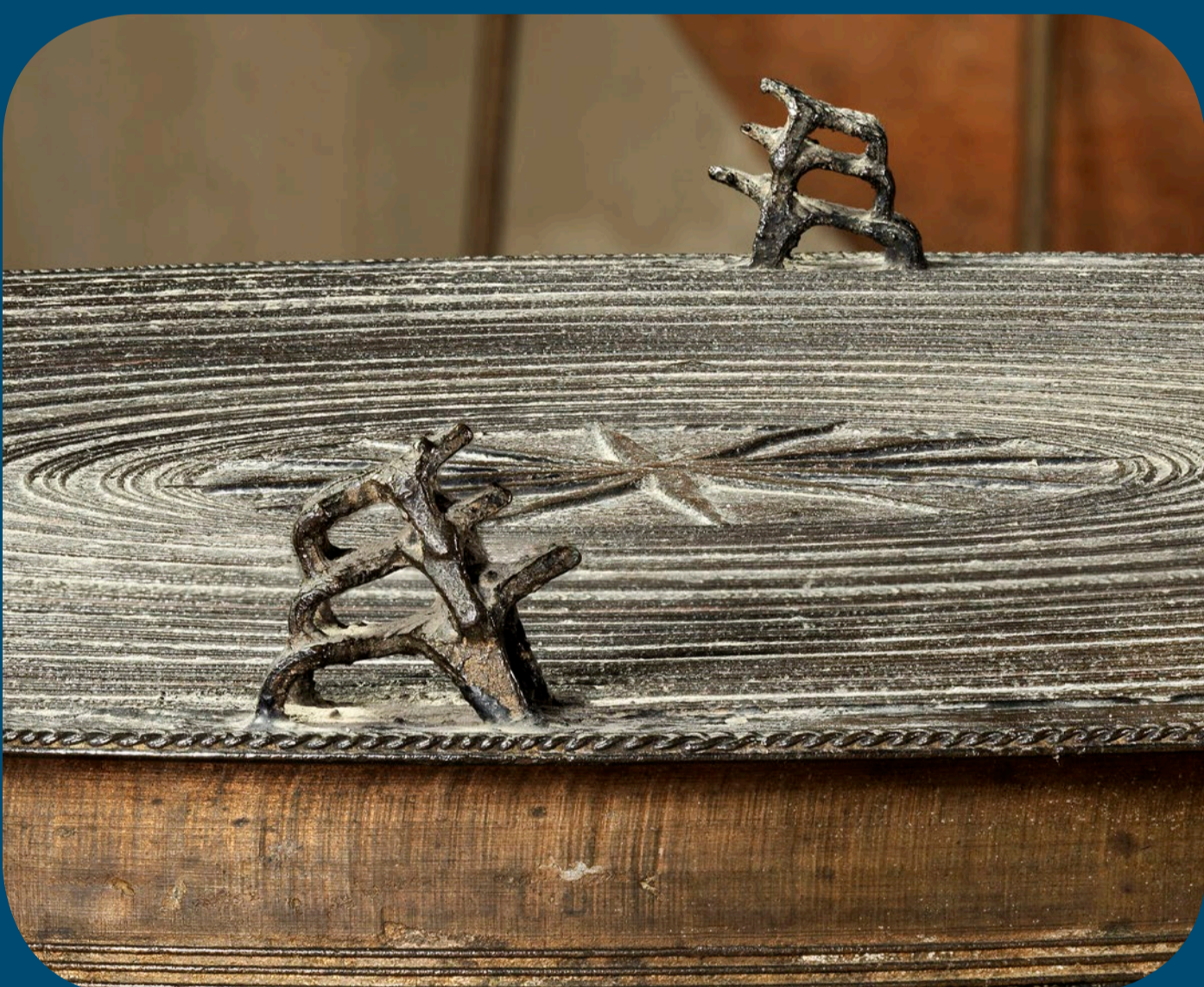
Tamboeur de bronze MAN 86190, H. 48 cm, D. 65 cm. Détail montrant les grenouilles stylisées sur le bord du tympan à motif de tresse.

Du type III de la classification établie par l'ethnologue Franz Heger à la fin du XIX e siècle, le tambour du MAN est composé de deux parties : une caisse de résonance légèrement évasée vers le bas et une partie renflée qui supporte un plateau débordant (tympan). Bien visibles, les coutures - renflements verticaux - indiquent les raccords entre les deux parties du moule ayant servi à fondre la caisse à la cire perdue. Une étoile à douze branches occupe le centre du plateau. Le reste du décor, organisé en zones concentriques présente des motifs géométriques ou des représentations d'animaux schématiques. Quatre groupes de trois grenouilles stylisées superposées ornent le bord du tympan souligné d'un motif de tresse. Dans sa partie supérieure, la caisse de résonance est dotée symétriquement de deux paires d'anses plates à décor de stries. Sur sa hauteur, elle est ornée d'une alternance de bandeaux de motifs incisés et de zones vierges de tout décor qui portent encore des vestiges de peinture noire. À la base et sur un seul côté de la caisse sont alignés verticalement trois colimaçons et trois éléphants miniatures.