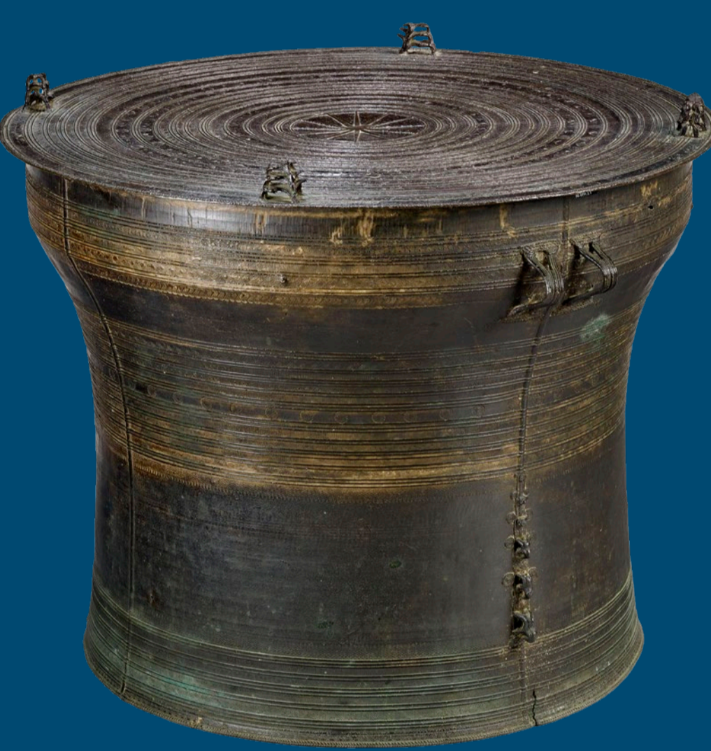
Tambour de bronze - Musée du quai Branly-Jacques Chirac - Inv. 70.2014.1.1 - Vietnam - XIX e siècle

En raison de ses dimensions réduites, de sa forme générale et de son décor de batraciens en relief, le tambour du MAN appartient assurément au type III qui date au plus tôt du XI e siècle et connaît une vaste dispersion entre le XV e et le XX e siècle dans toute l'Asie du Sud-Est. La comparaison avec un exemplaire très proche conservé au musée du quai Branly-Jacques Chirac confirme qu'il s'agit vraisemblablement d'une production vietnamienne ou birmane du XIX e siècle.