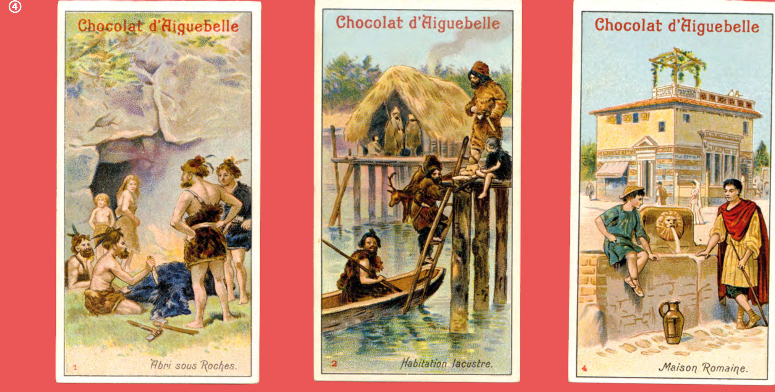
© Chromos publicitaires de la chocolaterie d'Aigüebelle Abri sous Roche ; habitation lacustre ; maison romaine MAN, collections du service des ressources documentaires

En 1867, 1878 et 1889, certaines sections des expositions universelles parisiennes contribuent à la vulgarisation de l'archéologie, notamment préhistorique. L'archéologie est justement l'une des sources revendiquées par Charles Garnier, qui cite le musée des Antiquités nationales dans la brochure qui accompagne son exposition. À travers l'évolution de l'habitation, il a l'ambition de retracer l'histoire de l'humanité. Il fait ainsi de l'architecture et de son pouvoir d'évocation la rivale de l'archéologie.