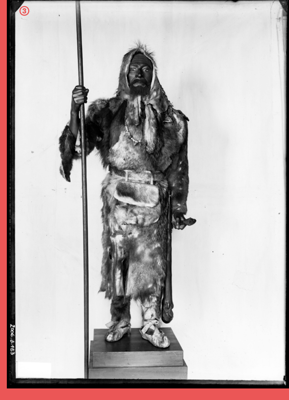
© Homme de l'Âge de la Pierre Mannequin n°1 de la Galerie des costumes de guerre du musée de l'Armée Musée de l'Armée, inv. 2006.3.133