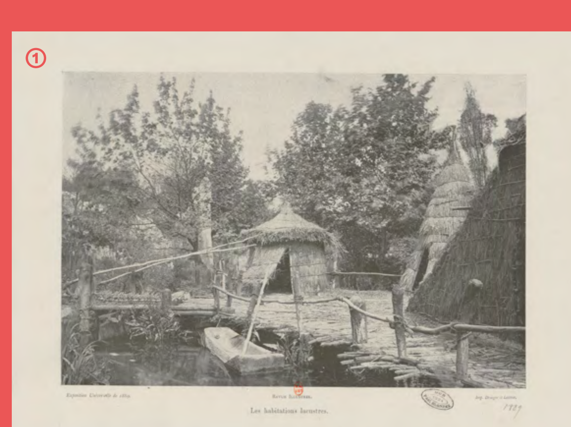
① Les habitations lacustres Exposition universelle de 1889

Ces assiettes de la manufacture Creil & Montereau sont produites à l'occasion de l'Exposition universelle de 1889, sur le thème de l'histoire de l'habitation. Les pavillons de cette exposition sont conçus par Charles Garnier, architecte du nouvel Opéra de Paris. Garnier a reconstitué plus d'une trentaine d'habitations, depuis la Préhistoire et les abris troglodytiques, aménagés dans la roche, jusqu'à la Renaissance, en passant par les maisons japonaise ou inca, qui s'alignent à proximité de la tour Eiffel récemment inaugurée ① ②. En homme du XIX e siècle, Garnier hiérarchise les peuples et leurs architectures.