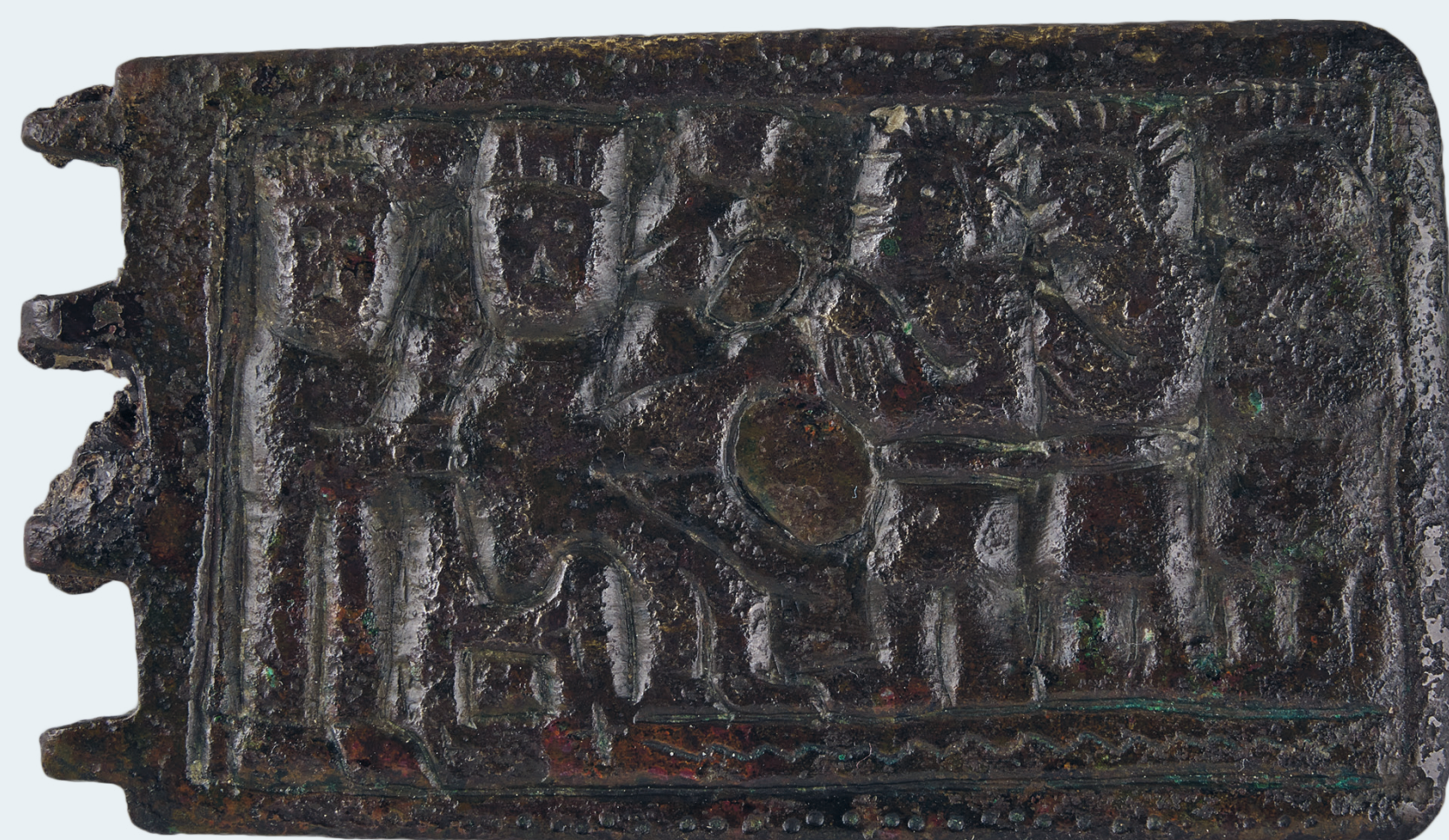
Plaque-boucle 91805 dite des Mages .

Tirée de l'Évangile selon Matthieu, l'histoire raconte que les Mages, guidés par une étoile, vinrent depuis Jérusalem pour apporter au Christ, à Bethléem, leurs offrandes. Sur notre plaque-boucle, on voit bien trois personnages se dirigeant vers la Vierge assise, tenant l'Enfant, et derrière elle, probablement Joseph.