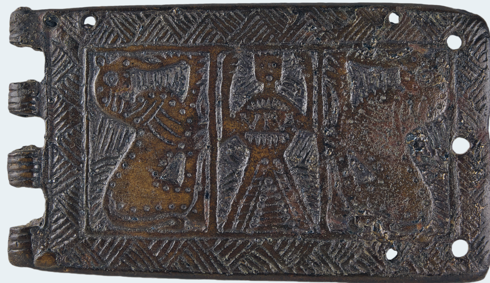
Plaque-boucle 91804 représentant probablement Daniel jeté dans la fosse aux lions.

Les plaques portant des images pieuses ne sont pas fréquentes dans le monde mérovingien ; elles proviennent souvent – mais pas seulement – du nord de la Bourgogne (approximativement, la Bourgogne-Franche-Comté actuelle) et sont produites à partir du VI e siècle. Parmi les images récurrentes, on trouve l'épisode biblique du prophète Daniel jeté dans la fosse aux lions, ayant miraculeusement survécu au supplice. C'est probablement ce que représente la deuxième plaque présentée ici. Cependant, les animaux qui y figurent pourraient, en fait de lions, être des griffons ; dans ce cas, le personnage central représenterait le Christ.