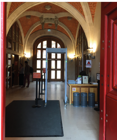
2 Le sas d'accueil

Aujourd'hui, à gauche du pont, vous pouvez voir deux allées couvertes en pierre. Elles recouvraient des tombes il y a plus de 5 000 ans. Elles ont été trouvées dans les Yvelines et apportées ici au 19 ème siècle.