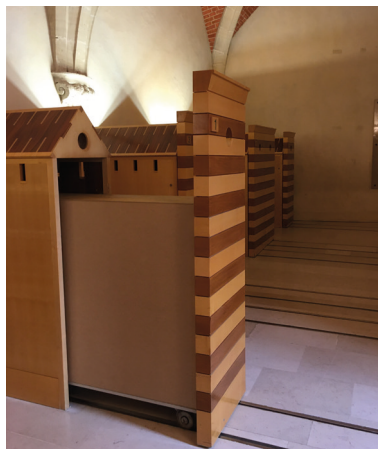
3 Le vestiaire

Comme dans les aéroports, vous devez passer sous un portique électronique. L'agent d'accueil vérifie le contenu des sacs pour la sécurité des visiteurs.