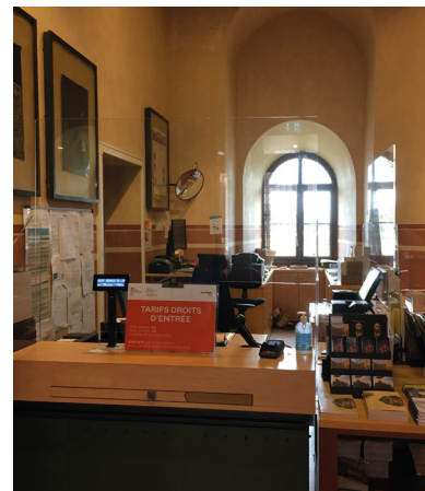
4 La billetterie-boutique

Il y a des casiers pour déposer les sacs à dos, les manteaux, les gros objets. Il faut demander à un agent d'accueil d'ouvrir un casier si vous venez en groupe. Vos affaires sont protégées et vous êtes à l'aise pour visiter le musée.