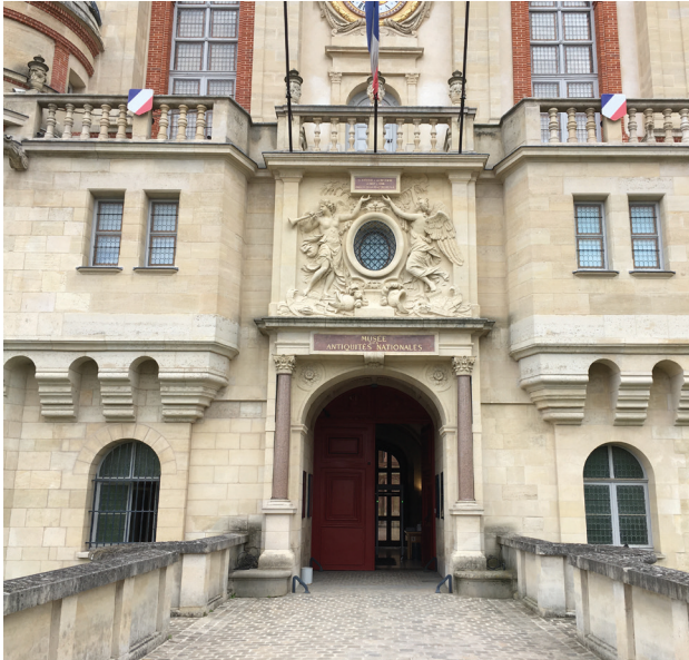
1 L'entrée du château et les douves

Pour entrer dans le château, vous passez sur une passerelle, vous traversez un pont en pierre.