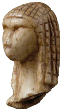
La « Dame de Brassempouy » :

Ils s'habillent avec des vêtements en peaux d'animaux.