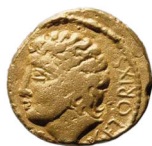
Monnaie en or de Vercingétorix, chef de la résistance gauloise contre les Romains à Alésia

Les Gaulois et leur chef Vercingétorix sont vaincus par l'armée de Jules César en 52 avant Jésus-Christ à Alésia, en Bourgogne.