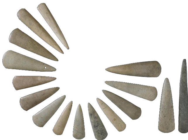
Haches en pierre polie

Ils transportent des matériaux sur de très longues distances.