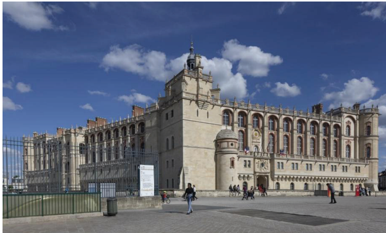
1 Le château vu depuis la sortie du RER A

Ce musée a ouvert en 1867 à la demande de l'empereur Napoléon III (« Napoléon trois »).