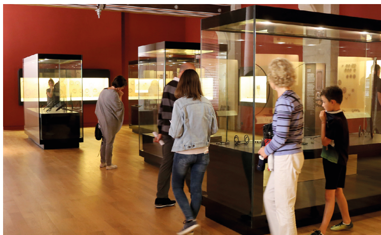
6 Une salle du musée, dans le château