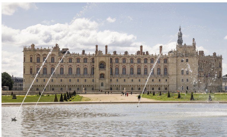
2 Le château et le grand bassin (depuis les jardins)

À côté du château, il y a un parc et des jardins (avec des arbres, des fleurs, des bassins remplis d'eau) : c'est le Domaine national .