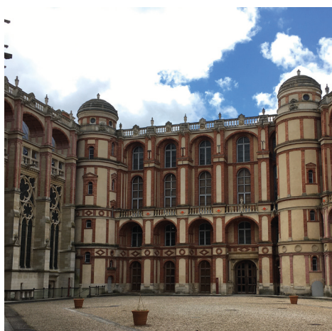
3 La cour intérieure du château