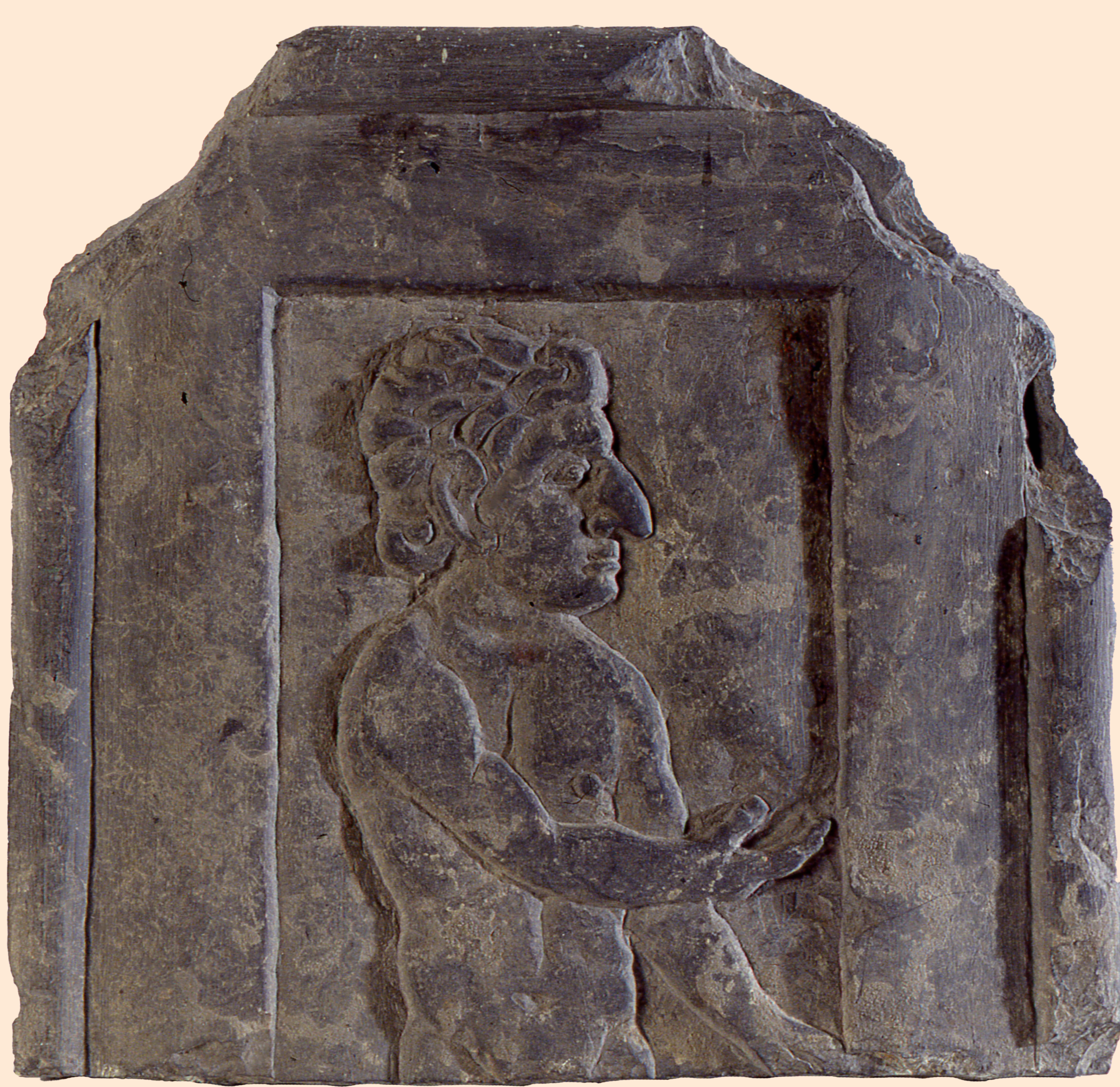
Placage de schiste. Homme nu. Don Harold de Fontenay à la Société Éduenne. Musée Rolin, Autun. (H. 32 cm ; L. 33 cm ; ép. 3 cm) © ville d'Autun.

Dès sa fondation sous l'empereur Auguste, la cité gallo-romaine, qui succède à Bibracte, l'ancienne capitale éduenne fait l'objet d'une attention particulière du pouvoir romain. D'emblée pensée comme le carrefour de grandes voies carrossables, elle est dotée de quatre portes monumentales et d'un rempart. Elle s'enrichit ensuite de nombreux monuments publics, remarquables par leur taille et leur qualité, et accueille des maisons aristocratiques au plan d'inspiration méditerranéenne dotées de jardins.