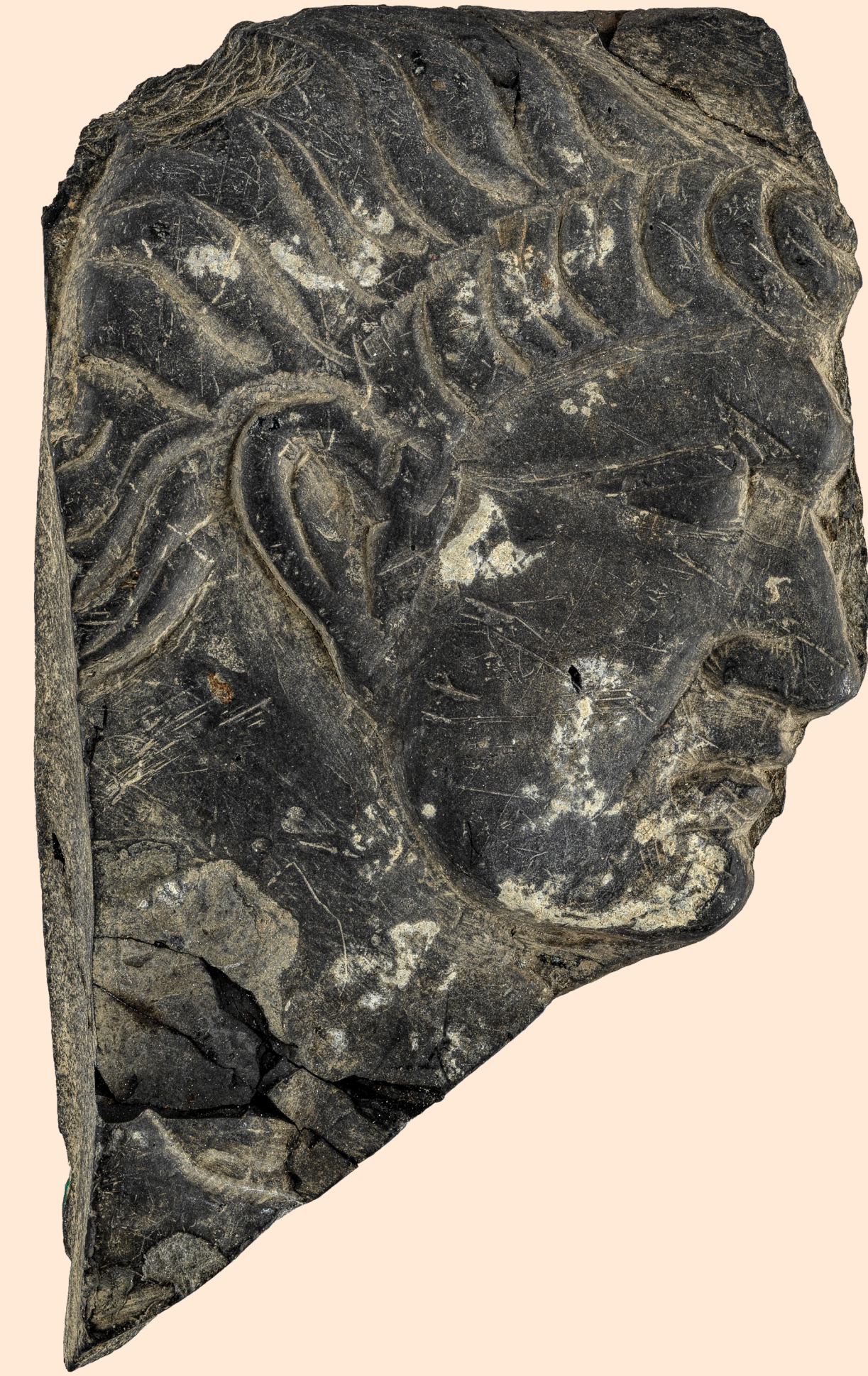
Placage de schiste à tête virile H. 18,6 cm ; L. 11,5 cm ; ép. 2,7 cm

La morphologie du schiste et son délitage naturel fournissent aux sculpteurs des plaques d'épaisseur régulière et faciles à travailler. On en tire principalement des objets de petite taille (dés à jouer, tesselles de mosaïque, fusaïoles...), mais aussi des décors muraux et des pavements de sol pour les riches demeures.