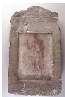
Stèle peinte. Alexandrie. MAN31232.