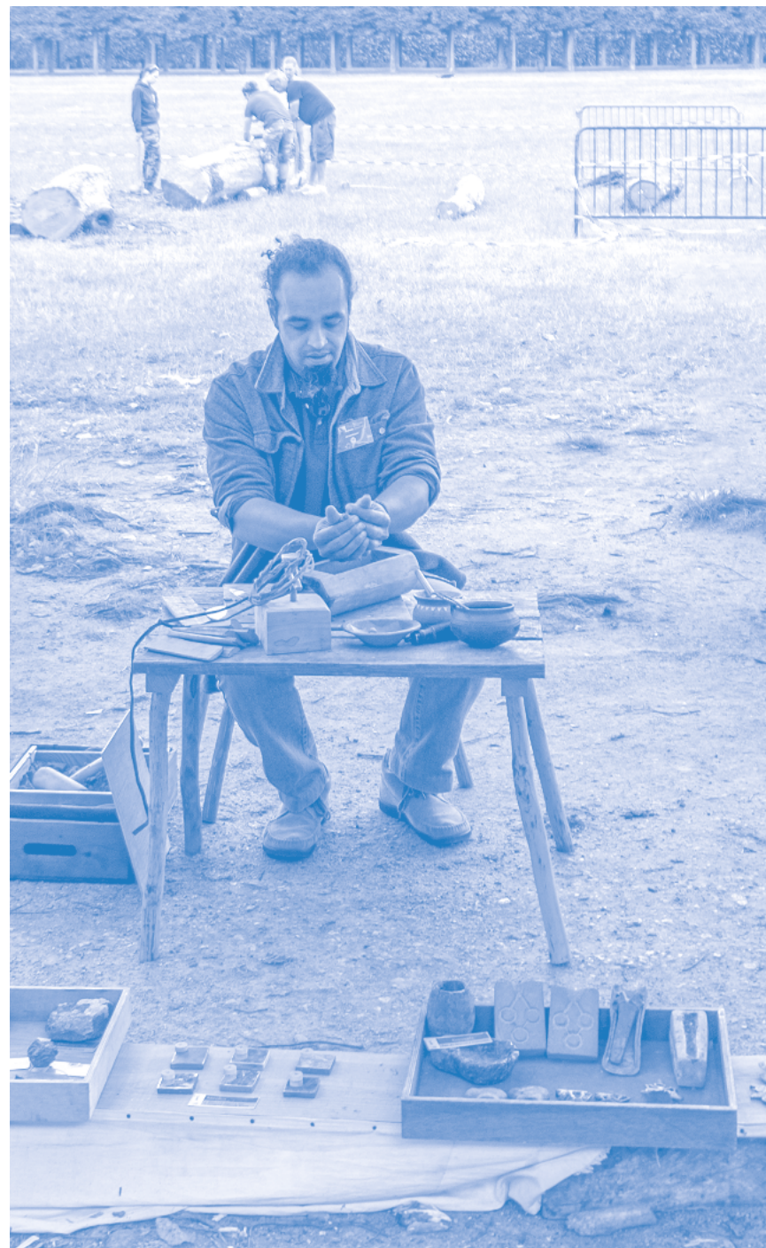
↑ Démonstration de la métallurgie du bronze