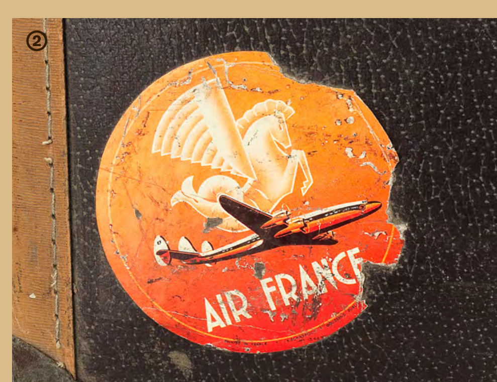
① Valise de l'adjudant-chef Marcel Brocquet Cuir, métal et tissu L. : 55 cm ; l. : 32 cm ; H. 17 cm France, vers 1959 Collection Marcel Brocquet ② Logo de la compagnie Air France Impression sur autocollant plastifié Diam. 9,5 cm © Air France, France, 1959