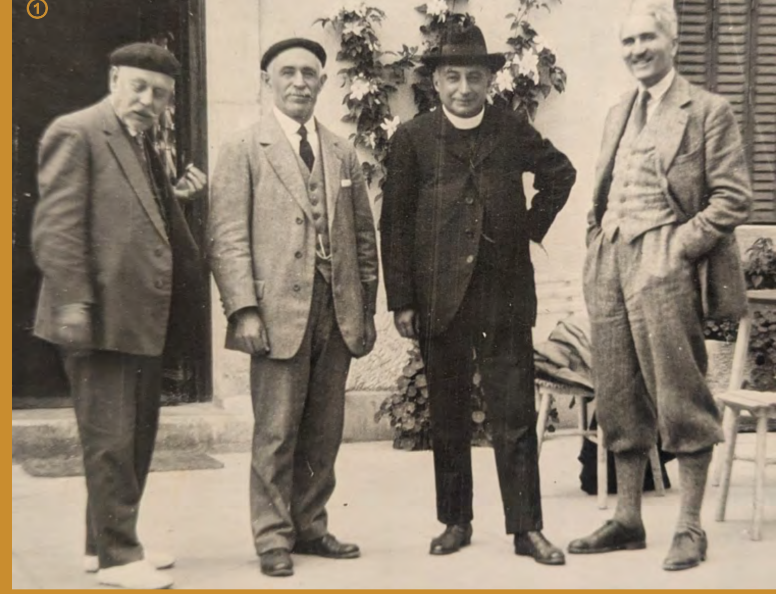
① Portrait de groupe (de gauche à droite) : Benoît-Claude Champion (1863-1952), Denis Peyrony (1869-1954), Henri Breuil (1877-1961), Raymond Vaufray (1890-1967) Les Eyzies (Dordogne), juillet 1931