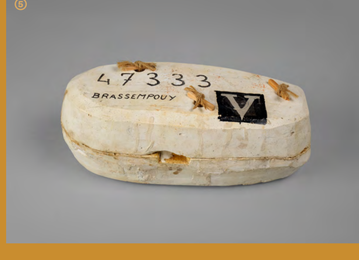
©-© Moule à bon creux à pièces, fermé et ouvert Atelier du musée d'Archéologie nationale, plâtre, XX e siècle, MAN, Atelier, collection de creux