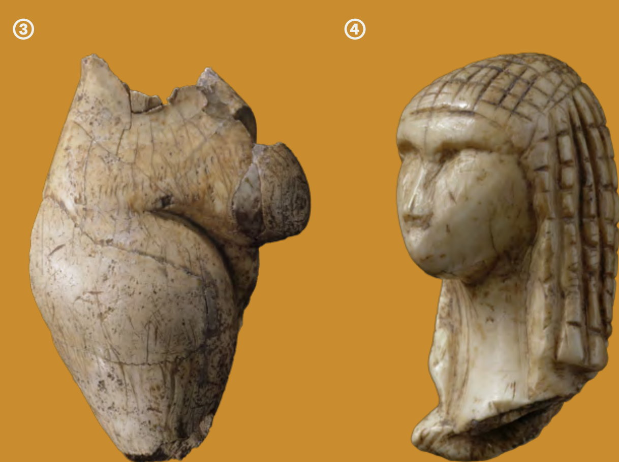
③ Statuette féminine dite « La Poire » Grotte du Pape à Brassempouy (Landes) Ivoire, Paléolithique supérieur (Gravettien) Fouilles de l'Association française pour l'avancement des sciences, 1892 MAN 47333 ④ Tête féminine dite « Dame de Brassempouy » ou « Dame à la capuche » Grotte du Pape à Brassempouy (Landes) Ivoire, Paléolithique supérieur (Gravettien) Fouilles d'Édouard Piette, 1894 MAN 47019

En 1902, lorsque Édouard Piette ② choisit de donner au musée des Antiquités nationales sa riche collection préhistorique, Champion est chargé du transport et de l’aménagement de la salle avec l’aide de Piette puis de l’abbé Breuil. Son attention est attirée par la série de statuettes féminines en ivoire découvertes entre 1892 et 1896 à Brassempouy (Landes) et notamment par deux d’entre elles, surnommées « La Poire » ③ et la « Dame à la capuche » ④.