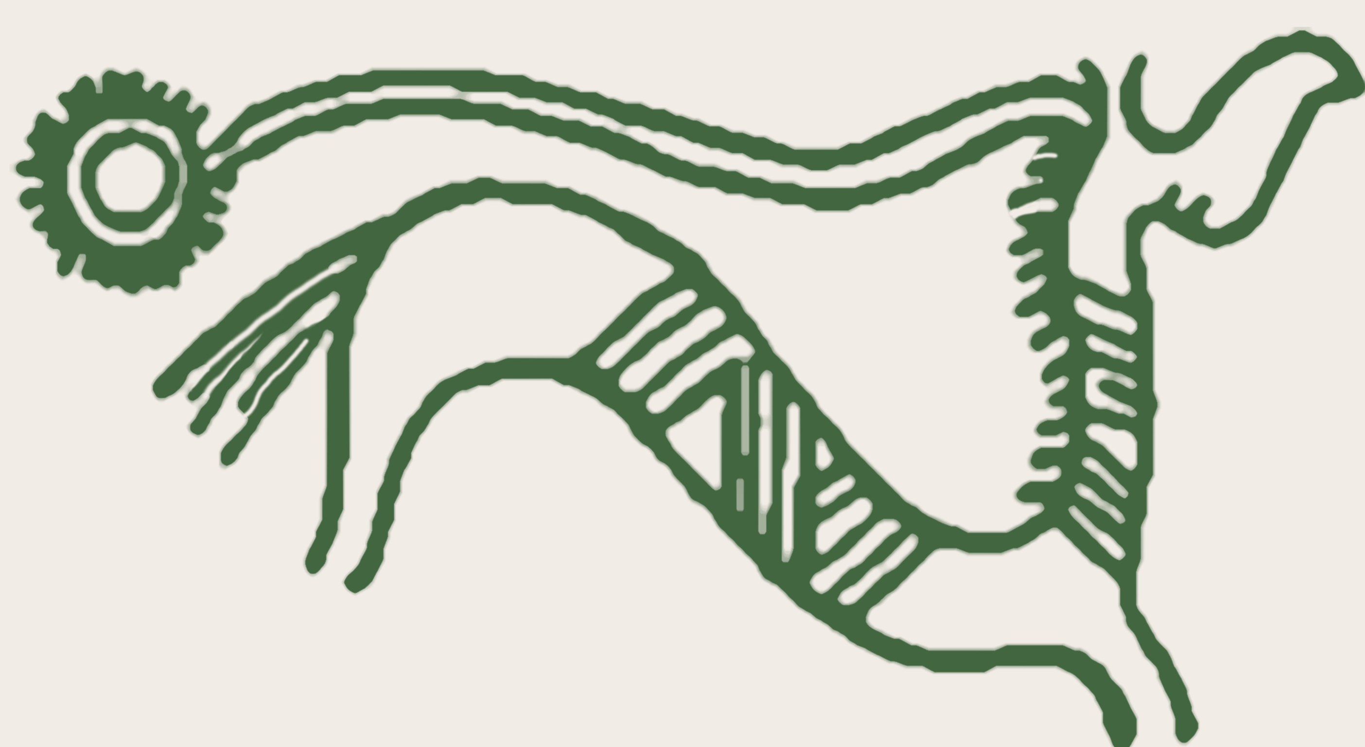
Figure 2: Cheval tirant le soleil figurant sur le rasoir de Neder Hvolris, Viborg Amt, Jutland (National Museet, Copenhagen, Danemark) 12 e /11 e siècles av. J.-C.