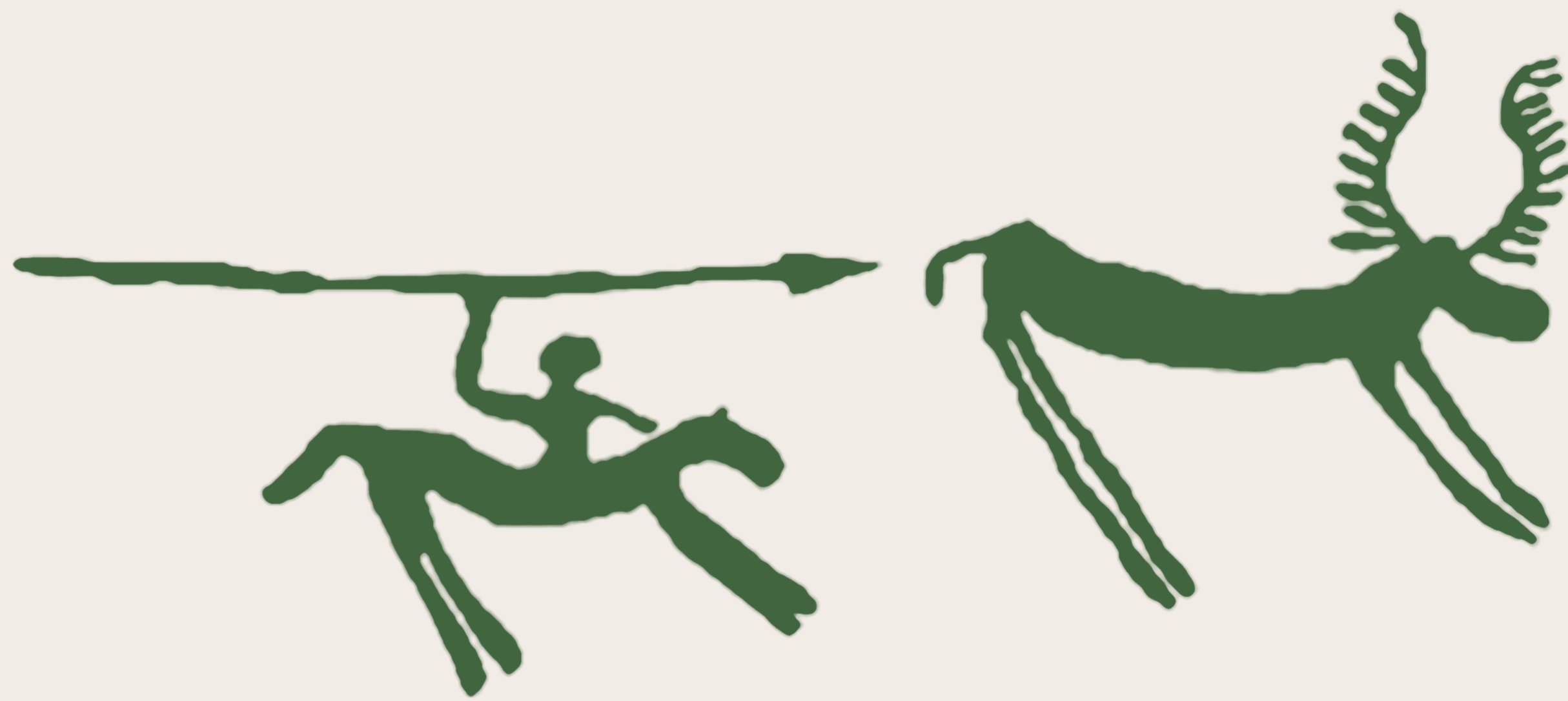
Figure 1: Scène de chasse au cerf gravée sur un rocher du Bohuslän (Suède), 14 e /9 e siècles av. J.-C.

Fabriqués par paire pour être disposés de part et d'autre de la bouche du cheval, les montants de mors apparaissent en Europe avec la domestication du cheval moderne, à partir de 2200 av. J.-C. Les recherches récentes ont permis de préciser l'histoire de la domestication de cet animal originaire des steppes du Nord Caucase. Doté d'un dos plus solide que les chevaux qui le précèdent en Europe, il est aussi plus docile, plus rapide et peut être utilisé aussi bien pour la traction des chars légers que pour la monte (fig.1).