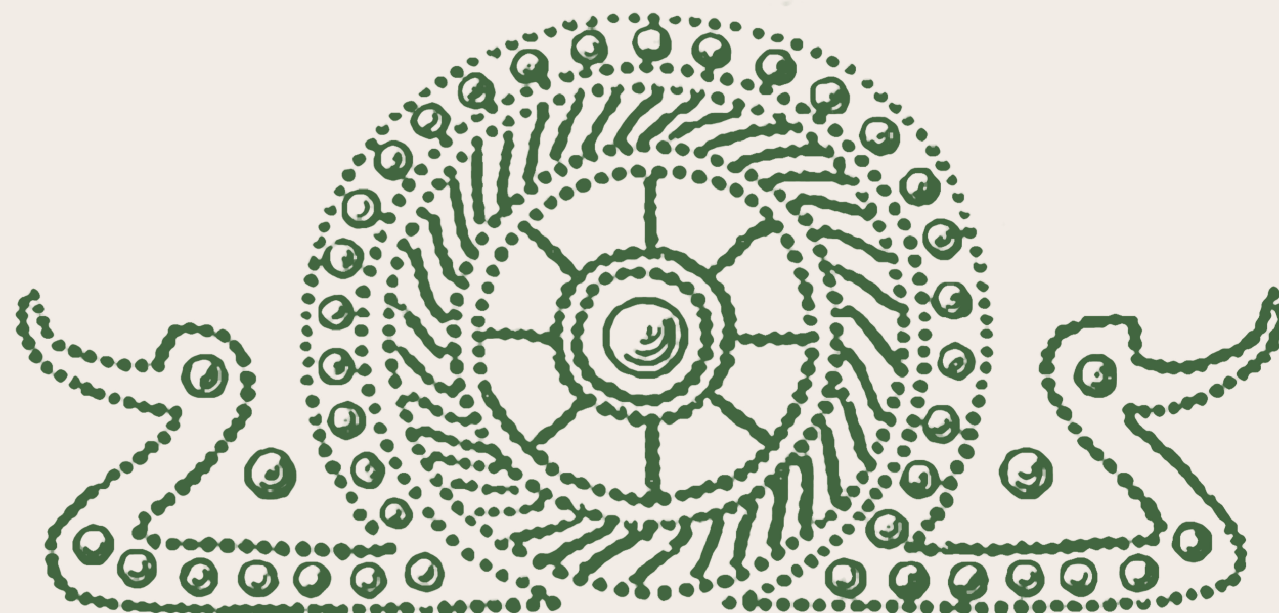
Figure 3: Motif de deux protomés d'oiseaux aquatiques encadrant une roue solaire, figurant sur la situle de Siem (National Museet, Copenhagen, Danemark) 12 e /11 e siècles av. J.-C.

Dès le 14 e siècle av. J.-C., au nord de l'Europe et à l'est des Alpes, le cheval est associé au motif du soleil et des oiseaux aquatiques. Il figure sur de nombreux objets précieux de la fin de l'âge du Bronze et du premier âge du Fer (fig. 2 et 3). Il est également gravé sur les rochers des sanctuaires de plein air, en Suède et au sud des Alpes, parfois combiné avec l'image du char ou de la barque, pour évoquer le cycle du soleil. Sur la plaque de mors récemment acquise par le musée, deux chevaux surmontent deux canards. Au centre, le soleil est symbolisé par une large perforation en forme d'anneau qui est destinée à permettre le passage des canons du mors (fig. 4).